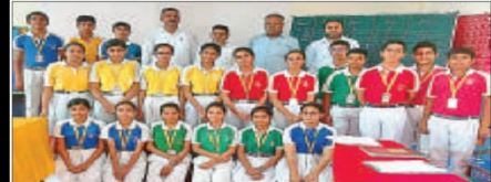
एच.डी स्कूल, खेड़ी-महम में हुई प्रश्नोत्तरी में विजेता टीम प्रबंधन समिति के साथ।

महम, 29 जुलाई (प्रीत): एच.डी. सीनियर सेकेंडरी पब्लिक स्कूल, खेड़ी-महम में शनिवार को अंतःसदनीय मैथ्स एवं साइंस क्रिज का आयोजन किया गया।