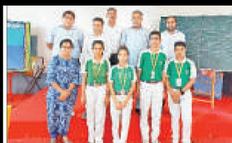
महम | एचडी स्कूल खेड़ी महम में आयोजित प्रश्नोत्तरी प्रतियोगिता के विजेता विद्यार्थी अपने गुरुजनों के साथ।